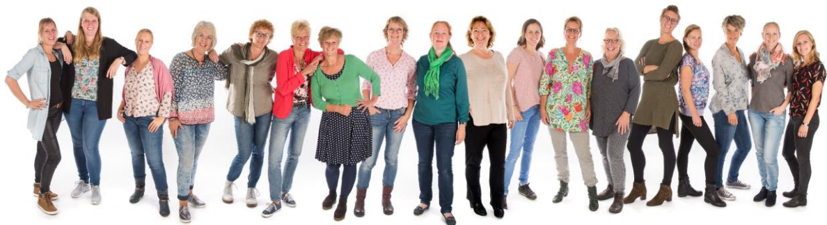
Het team van De Kleine Wereld

Wij wensen iedereen een LEERZAAM, GEWELDIG ÉN FIJN schooljaar 2020-2021 toe met veel kansen en mogelijkheden!